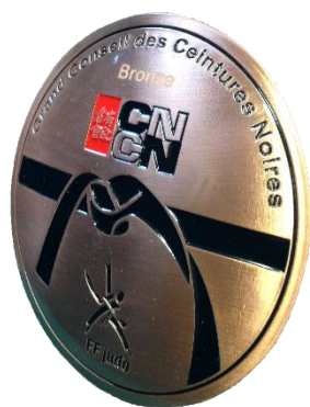
Médaille de bronze