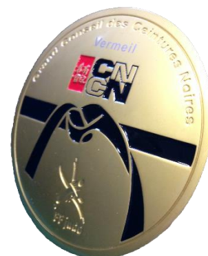
Médaille de vermeil